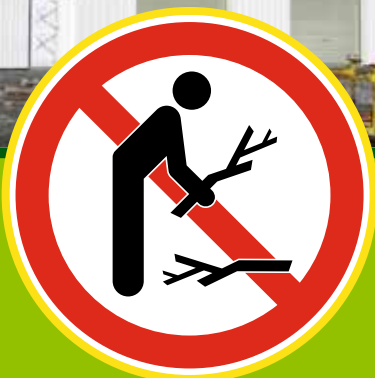
Page 05 Règlementation