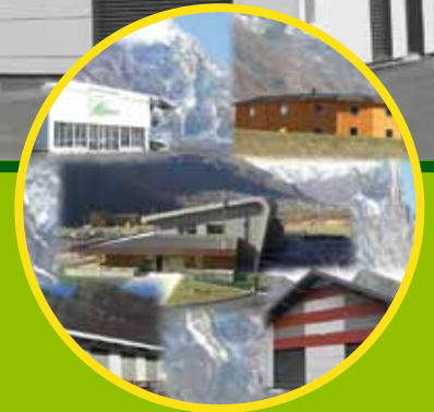
Page 30 Entreprises nouvelles