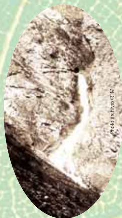
Cascade à la sortie du tunnel Mougín

Bar Restaurant "Les Ullions" à Montdenis Tél : 04.79.59.62.76 Hôtel Restaurant Bar "Lancheton" à Saint Julien Tél : 04.79.59.68.91